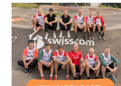
WIR WAREN DABEI

eine grosse Bandbreite: Von Madonna, Old School, den 2000ern, den Step Up-Filmen über Miley Cyrus bis hin zum Klimawandel war alles dabei.